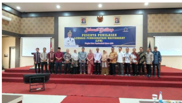
Lomba LPM TK Kota Paakumbuh Kelurahan Kapalo Koto apagan