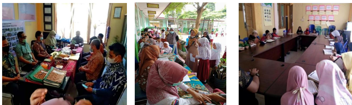
Gambar 3.7 dari Kiri : Keg pokja Kec Sehat, UKS, Pondok Quran

Adapun program lain yang mendukung Capaian kinerja sasaran Meningkatnya peran aktif masyarakat dan lembaga kemasyarakatan dalam pembangunan adalah PROGRAM PENYELENGGARAAN URUSAN PEMERINTAHAN UMUM, kegiatan Penyelenggaraan Urusan Pemerintahan Umum sesuai Penugasan Kepala Daerah dengan Sub Kegiatan Pelaksanaan Semua Urusan Pemerintahan yang Bukan Merupakan Kewenangan Daerah dan Tidak Dilaksanakan Oleh Instansi Vertikal. Program ini merupakan salah satu upaya pembangunan pemerintah kecamatan payakumbuh selatan untuk meningkatkan peran serta masyarakat dalam mendukung kegiatan dibidang Keagamaan Melalui Pondok Al Quran Al Amin dan mendukung program pemerintah di bidang kesehatan melalui UKS dan Pokja Kecamatan/ Kelurahan Sehat