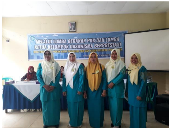
Lomba Ketua Dasawisma