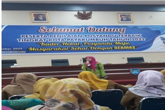
Lomba Posyandu Berprestasi