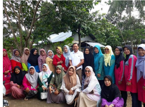
Lomba Dasawisma TK Kota Payakumbuh