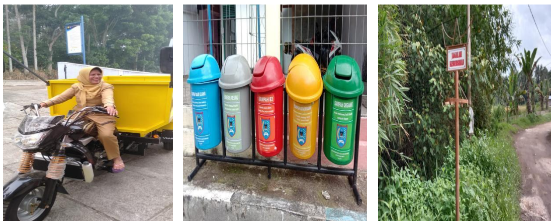
Gambar 3.3 Sarana penunjang pengelolaan Sampah

Gambaran tentang program, kegiatan, pagu, realisasi anggaran, output serta dampak terhadap capaian kinerja dapat dilihat pada tabel berikut :