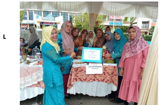
Lomba FORIKAN TK Kota Payakumbuh