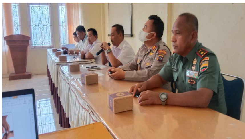
Gambar 3. 2 Rapat Koordinasi Sekaligus Sosialisasi Keamanan dan ketertiban

Sasaran Meningkatnya Kualitas Layanan Publik juga didukung oleh PROGRAM KOORDINASI KETENTRAMAN DAN KETERTIBAN UMUM dengan Kegiatan Koordinasi Upaya Penyelenggaraan Ketentraman dan Ketertiban Umum dan Sub Kegiatan Sinergitas dengan Kepolisian Negara Republik Indonesia, Tentara Nasional Indonesia dan Instansi vertikal di wilayah kecamatan, dengan melakukan sosialisasi koordinasi serta monitoring kemananan dan ketertiban di lingkungan kelurahan se Kecamatan Payakumbuh Selatan, kegiatan ini melibatkan Palanta Kelurahan, Babinsa dan Babinkantibmas, dengan adanya kegiatan koordinasi dan monitoring tersebut dapat mendukung pencapaian kepuasan masyarakat terhadap layanan yang diberikan khususnya dibidang keamanan dan ketertiban.