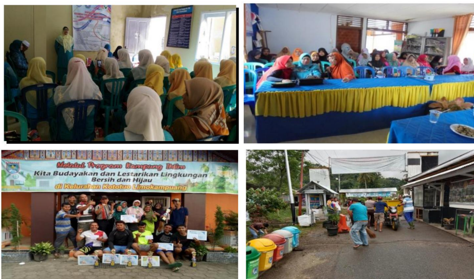
Gambar 3.5 pelaksanaan Kegiatan Pemberdayaan Masyarakat

masyarakat desa dan kelurahan dilaksanakan tidak hanya melalui Kegiatan pelatihan peningkatan kualitas SDM Pengurus , pendampingan / pembinaan yang dilaksanakan melalui rapat koordinasi 1 kali dalam sebulan dan pembinaan langsung ke lembaga kemasyarakatan tetapi juga lomba yang secara psikologis dapat meningkatkan kompetensi dari lembaga kemasyarakatan di kelurahan.